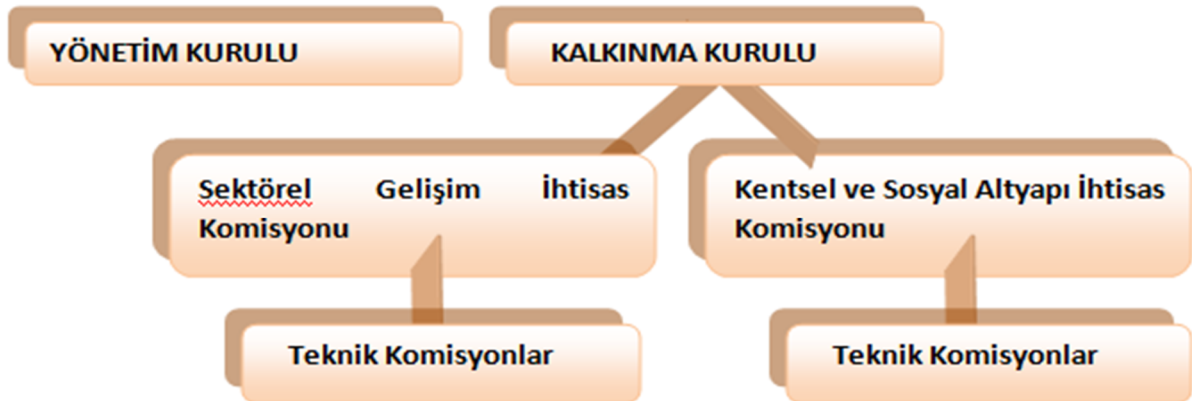
Tablo 3: İhtisas Komisyonları ve Teknik Komisyonlar

Kalkınma Kurulu bünyesinde kurulması önerilen ihtisas komisyonları ve teknik komisyonlar Tablo 3' te gösterilmektedir.